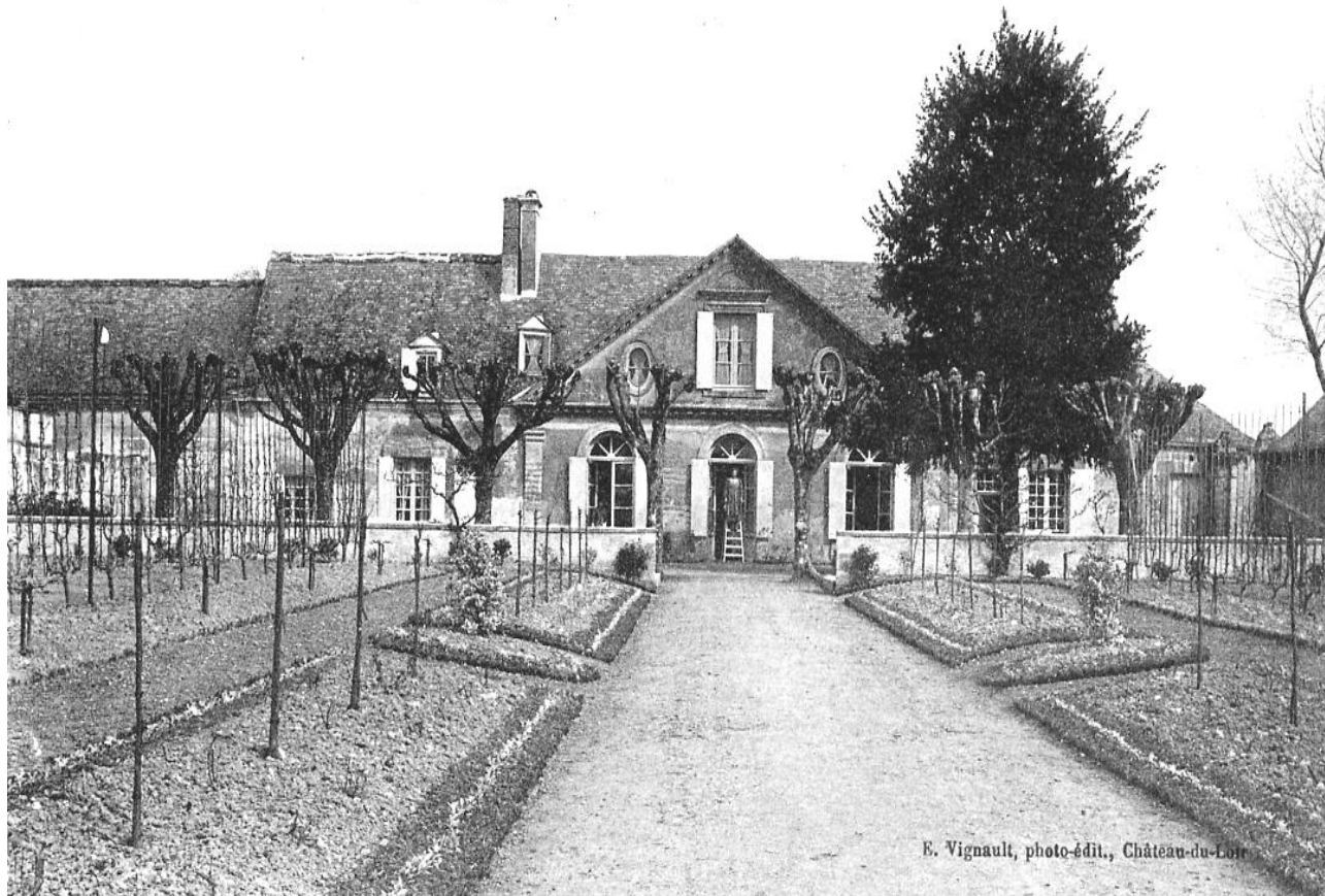
SAINT-CRISTOPHE (l.-et-L.) — Villa Saint-Gille